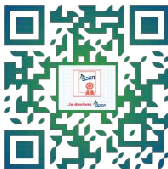
Je deviens DDEN