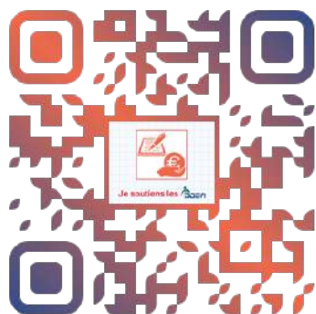
Je soutiens les DDEN

Les articles 9 et 10 n'ont pas fait l'objet d'amendements majeurs. Rappelons que l'article 9 étend les délais de prescription et étend aux ministres du culte l'obligation de dénonciation d'actes de violences sur mineurs. L'article 10 est purement rédactionnel.