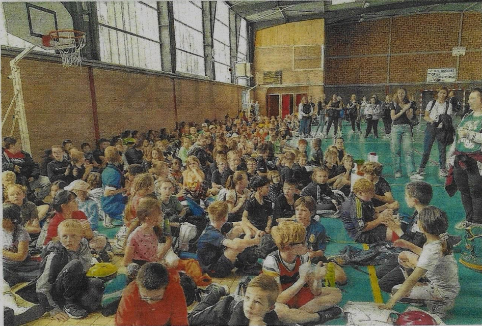
Les élèves des cours moyens attendaient les résultats du palmarès avec impatience.

Les Scolympiades ont rassemblé les élèves de Campagne-les-Wardrecques et Arques dans des challenges sportifs. Un projet ambitieux qui a fait l'unanimité.