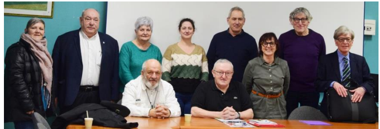
Assemblée Générale du 16 Mars à Barlin en présence d'élus et de nos partenaires