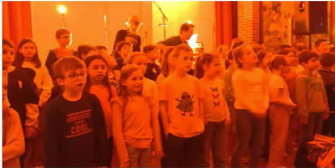
Le groupe Archimède a chanté « Mon quotidien » avec les petits Laboursois.