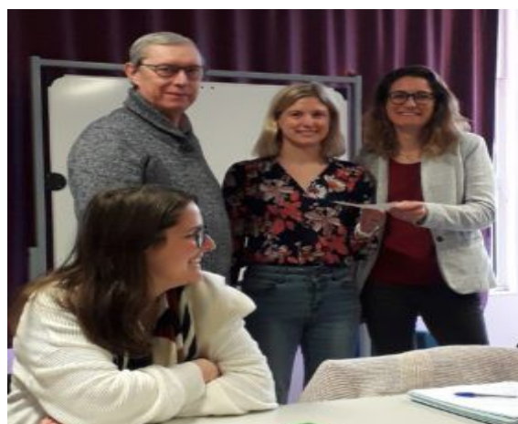
Remise de chèque Délégation de Beuvry