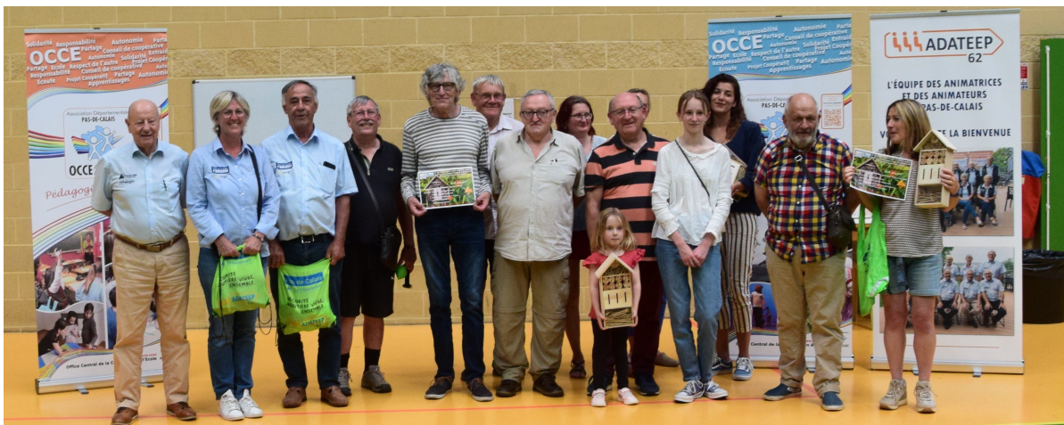
Rassemblement à Bully-les-Mines DDEN/OCCE/ ADATEEP pour les « Écoles fleuries »