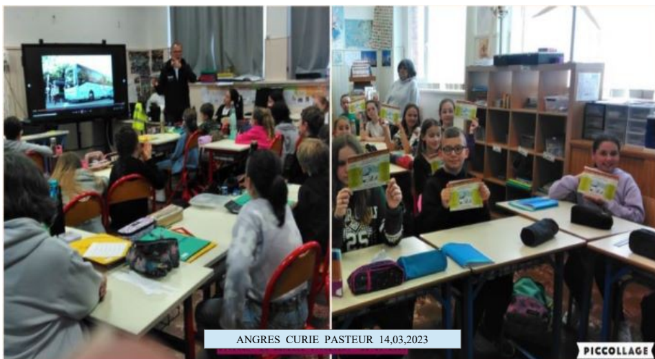
ANGRES CURIE PASTEUR 14,03,2023