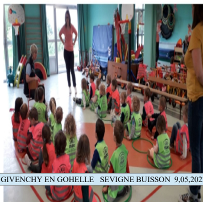
GIVENCHY EN GOHELLE SEVIGNE BUISSON 9,05,2023