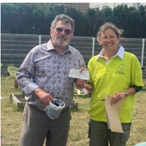
Remise de chèque « écoles fleuries » lors du rassemblement à Calais.